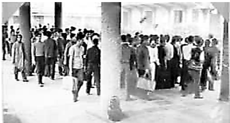
Tại sân ga Dalat, những chàng trai được Khóa 17 tiếp đón. Đồng hồ trên nhà ga chỉ đúng 10 giờ 37 phút sáng ngày 23 tháng 11 năm 1962.