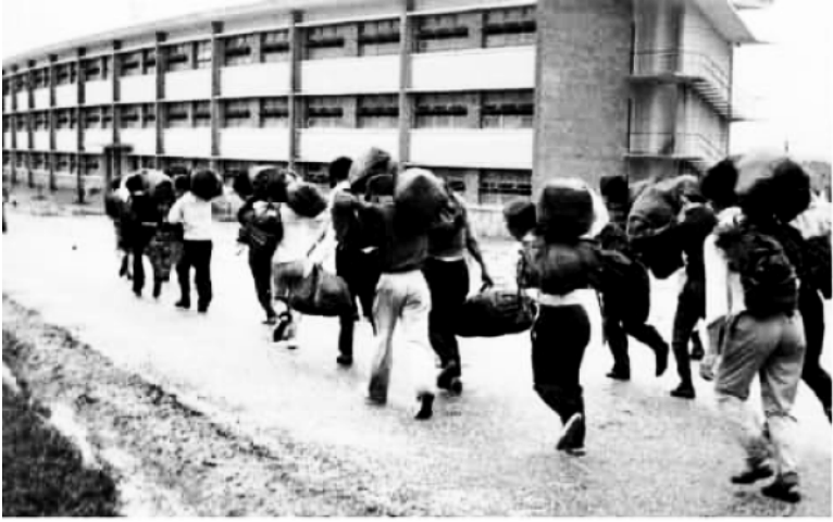
Tất cả quần áo, giày dép, chăn gối, mũ sắt . . . nhét vào túi quân trang và balô . . . rồi vác lên vai chạy về trại . . .