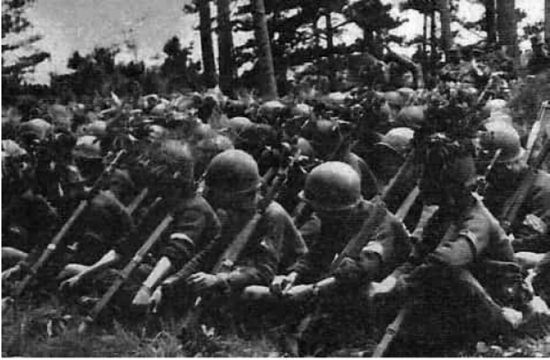
Lớp học tác chiến