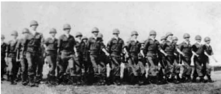
Lần đầu tiên TKS Khóa 19 tham dự diễu hành tại Vũ Đình Trường Lê Lợi trong buổi lễ Khai Mạc Mùa Quân Sự.