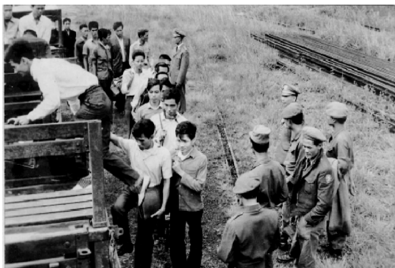
Lên xe GMC do các tài xế của Tiểu Đoàn Công Vụ TVBQGVN chuyển vận từ Ga Dalat về Trường.