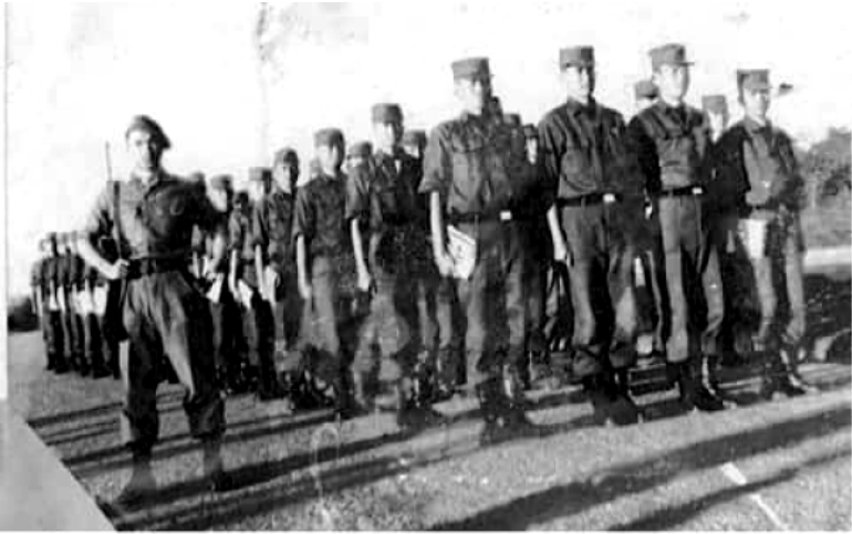
TKS đi chuyển đến lớp học dưới sự hướng dẫn của SVSQ/ CB/