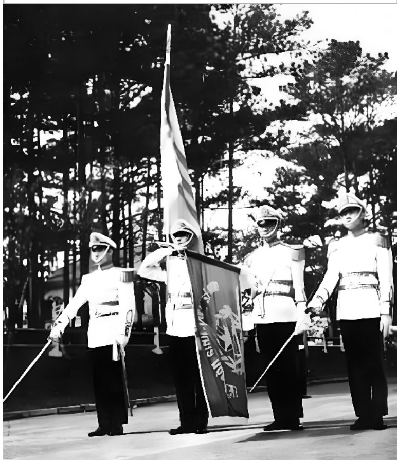
Khối Hiệu Kỳ Liên Đoàn SVSQ Khóa 19