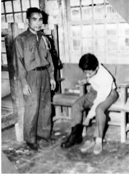
Lãnh quân trang tại Tiểu Đoàn Công Vụ, khu Quang Trung