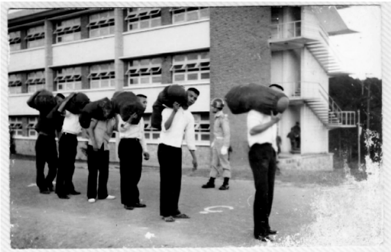
Sẵn sàng leo lên cầu thang “hai bên” và đây là lần đầu tiên bước vào doanh trại nhận phòng ở