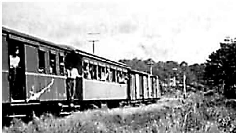
Đêm 22-11-1962, ngủ tại Ga Tháp Chàm, và sáng sớm hôm sau, những chiếc toa có móc xích chuyển hướng leo dốc Krông Pha lên Dalat