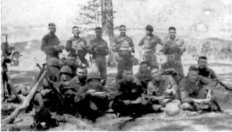
Những giây phút thoải mái ngoài bãi trong giờ ăn