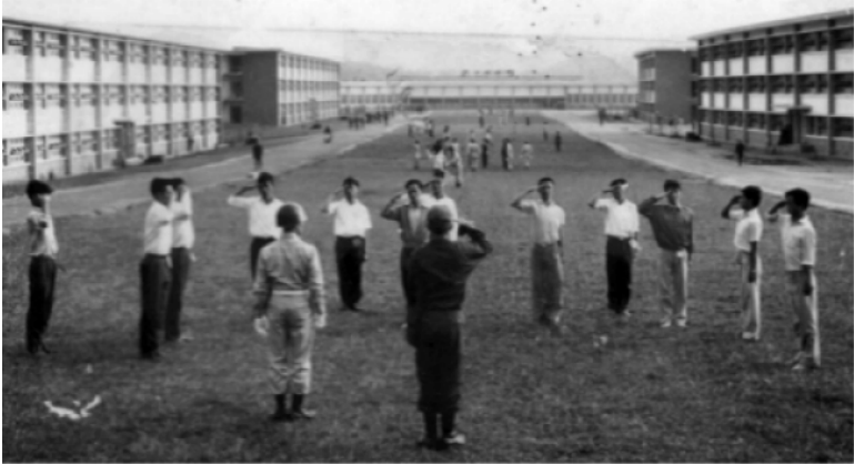
Trên sân cỏ Liên Đoàn SVSQ ngày đầu tiên của TKS K19 thật là rộn rịp . . .