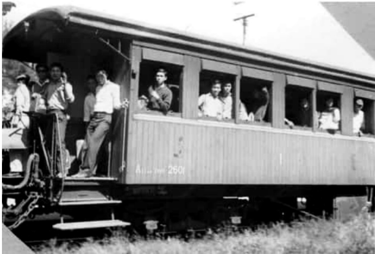
6 giờ sáng ngày 22 tháng 11 năm 1962, chuyến xe lửa tốc hành Saigon-Huế lãn bánh.