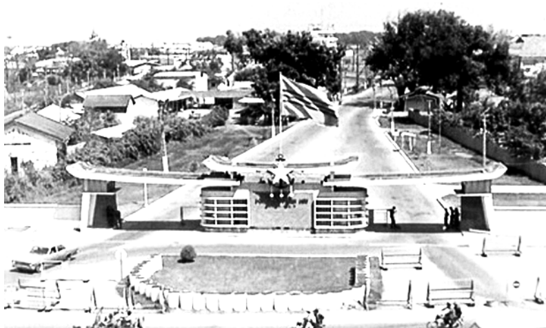
Bộ Tổng Tham Mưu QLVNCH

Qua lời khai, người viết nghĩ rằng nếu hẳn biết rõ sơ đồ BTTM thì tên này cứ cho bung rộng rồi tiến chiếm Trung Tâm Hành Quân và toà nhà chánh, nơi Tổng Tham Mưu Trưởng và vài tướng lãnh làm việc. Lúc đó tình thế không biết ra sao vì