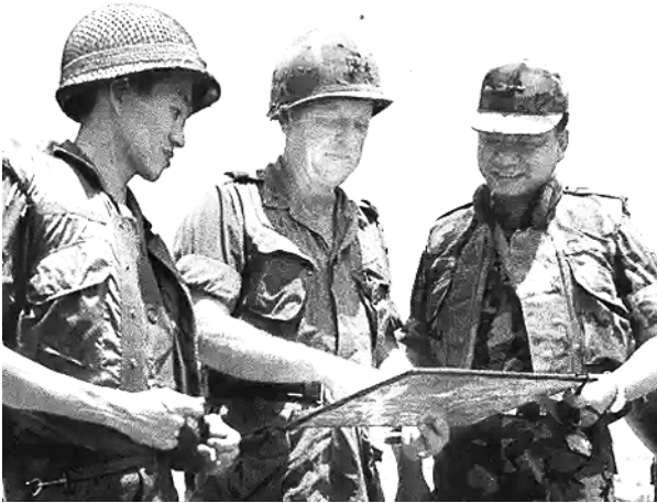
ĐT Ngô Quang Trưởng, Tướng Tolson, Tướng Đur Quốc Đống (4/1968) (từ trái).

tình hình lãnh thổ Vùng II thì hãy xuống Trung Tâm Hành Quân mà hỏi. Ở đó luôn có đầy đủ tin tức.