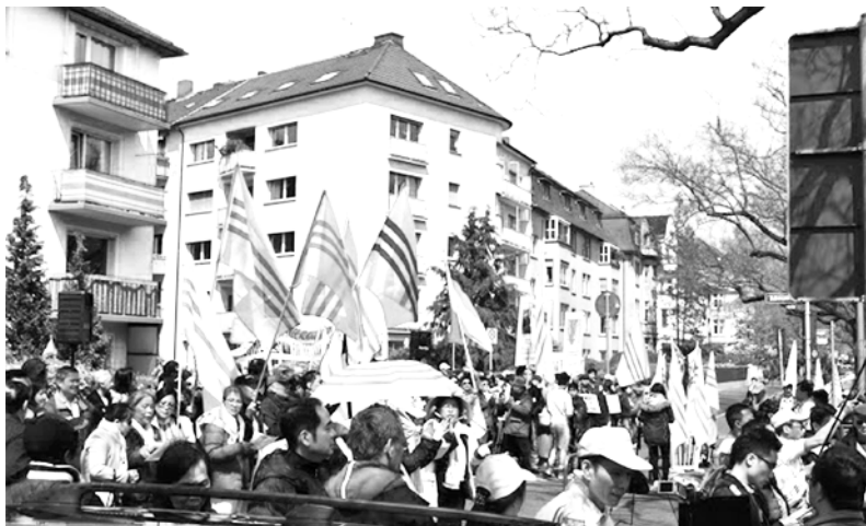
Phản đối công ty Formosa trong cuộc biểu tình Ngày Quốc Hận tại Frankfurt am Main, Đức Quốc, 2016

là tại Mỹ, nơi quốc hội nhiều tiểu bang, và nhiều hội đồng thành phố đã ban hành các nghị quyết công nhận cờ vàng ba sọc đỏ là cờ chính thức của người Mỹ gốc Việt tại Hoa Kỳ. Sự đoàn kết của người Mỹ gốc Việt đã khiến người Mỹ bản xứ lắng nghe tiếng nói chung của họ, hiểu được nguyện vọng thiết tha của họ: xác nhận chính nghĩa của họ trong việc tranh