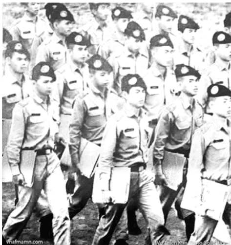
Khoá 25 trên đường tới lớp học

Còn lỗ như quá khứ của một người là thảm họa, đau buồn, thì thái độ sẽ là sự lắng đọng, suy tư và chấp nhận để trở thành hoài niệm. Đằng sau... quay, là một loại biến thể, có thể xem như chiêu thức độc đáo trong binh pháp: “Tam Thập Lục Kế”, thì “Tẩu Vi Thượng Sách”. “Tẩu” là chạy thực mạng, là tránh tai họa, là xa lánh cái xấu. Ở tuổi già, thì “tẩu” với bệnh hoạn, với cái chết là đúng rồi. Con nhà lính, bài cơ bản thao diễn đầu tiên mà SVSQ cán bộ đã dạy: “Đằng sau... quay”, thì cứ mà quay. Đi tới không được thì “quay”, giải quyết chuyện gì cũng không xong, thì “quay”. Trường VBQG đã dạy SVSQ quay, thì cứ mà “quay”, không ai có thể thắc mắc, bắt bẻ được, phải không SVSQ?