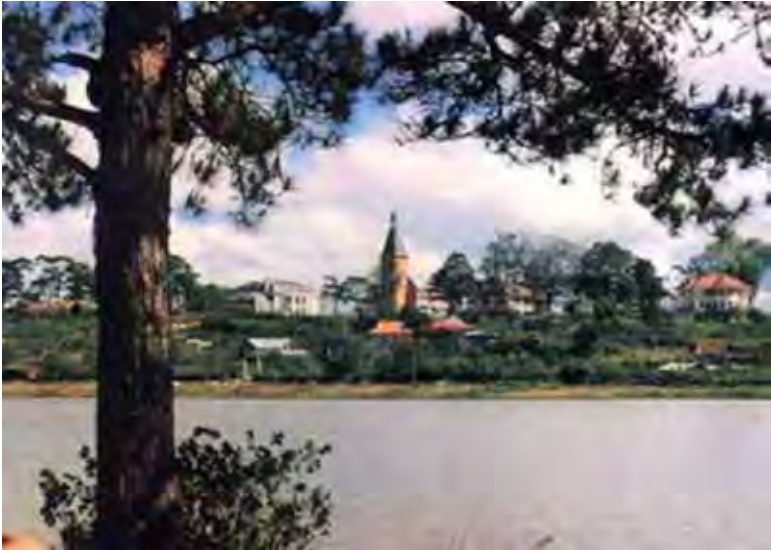
Trường trung học Couvent des Oiseaux