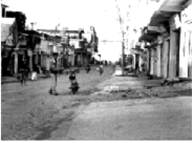
Đường Phan Bội Châu