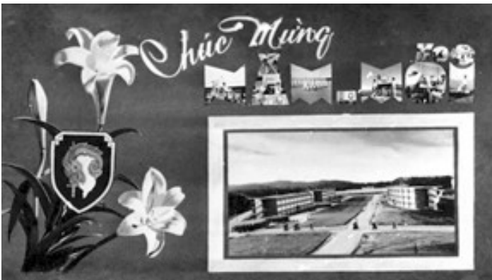
Thiệp chúc Tết của TVBQGVN