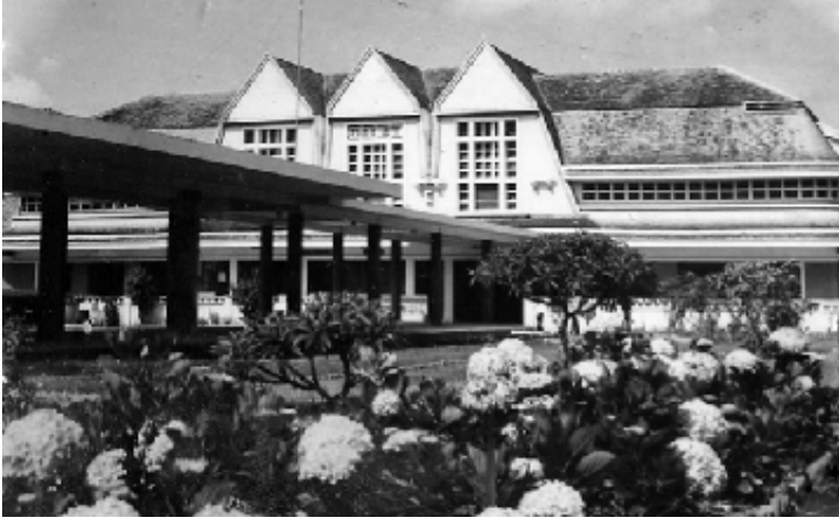
Ga xe lửa Dalat