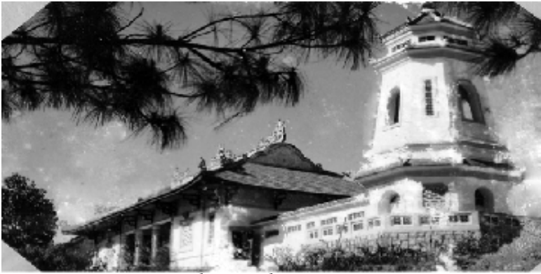
Chùa Linh Sơn