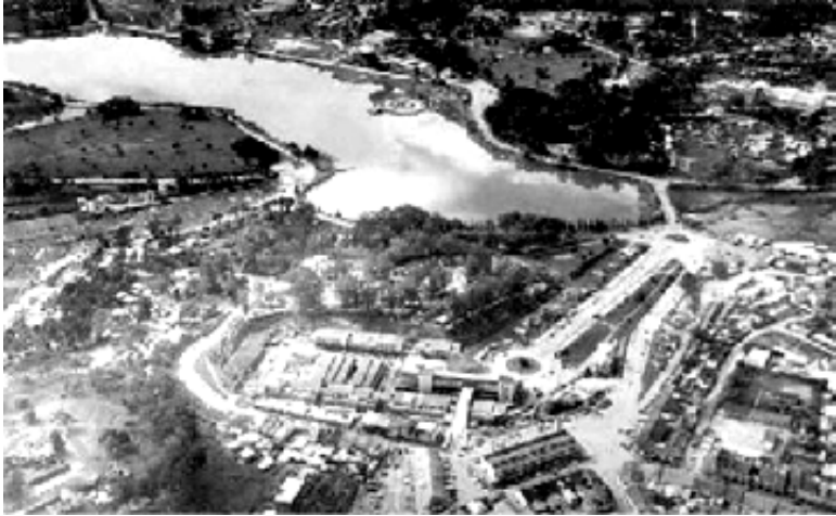
Thành phố Dalat