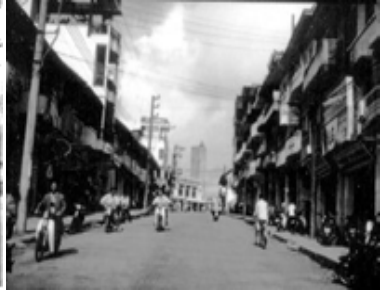
Đường Duy Tân