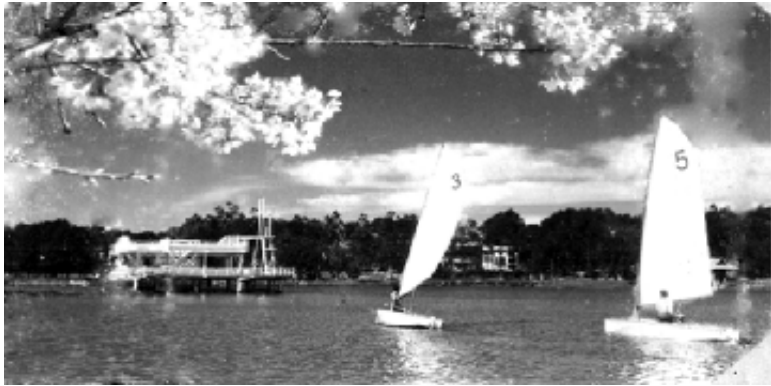
Hồ Xuân Hương Dalat