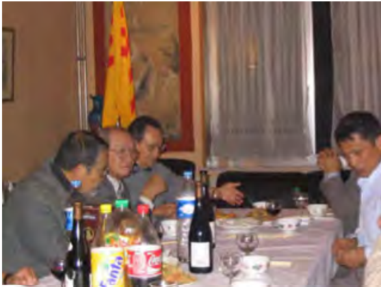
Thảo luận Sinh hoạt