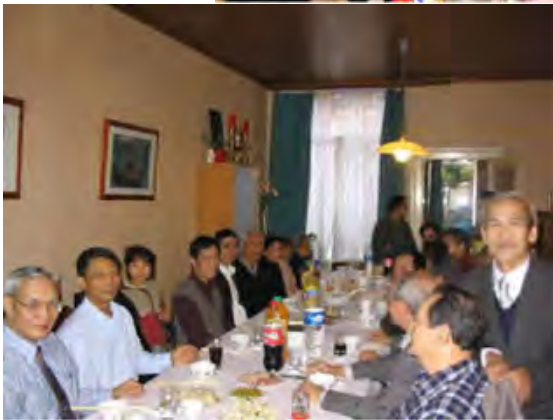
LHT và quý huynh đệ VB tại Âu châu