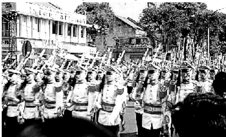
Khóa 21 diễn hành ngày Quốc Khánh 1 tháng 11, 1965.

hay không? Nhưng mà mỗi lần tập họp tại sân cỏ Liên Đoàn thì thấy sao mà SVSQ cán bộ nhiều thế? K21 chúng tôi nhập trường chưa tới 250, mà khóa đàn anh K20 có đến trên 400 người. K21 bị mang tiếng là khóa biểu tình làm cho các NT của chúng tôi bị cấm trại liên miên. Có lẽ vì thế mà những buổi học toàn khóa tại nhà H, khi được hỏi, “Có ai thắc mắc gì không?” thì cả khóa trả lời “ Không ”, “ Có ý kiến gì không? “Không ”. Cái gì cũng Không và Không . Đến đời mà Thiều Tá, Liên Đoàn trưởng LĐ SVSQ, phải đặt tên cho K21 là