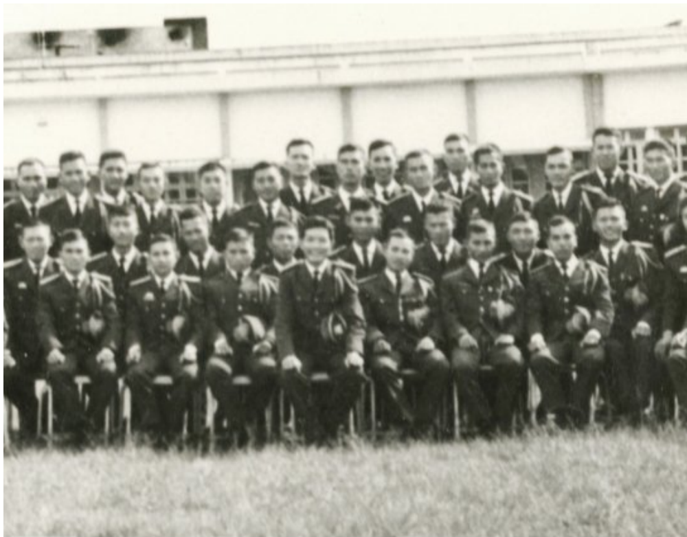
Đại Đội B/21 (Ảnh chụp trước khi mãn khoá tháng 10/1966)