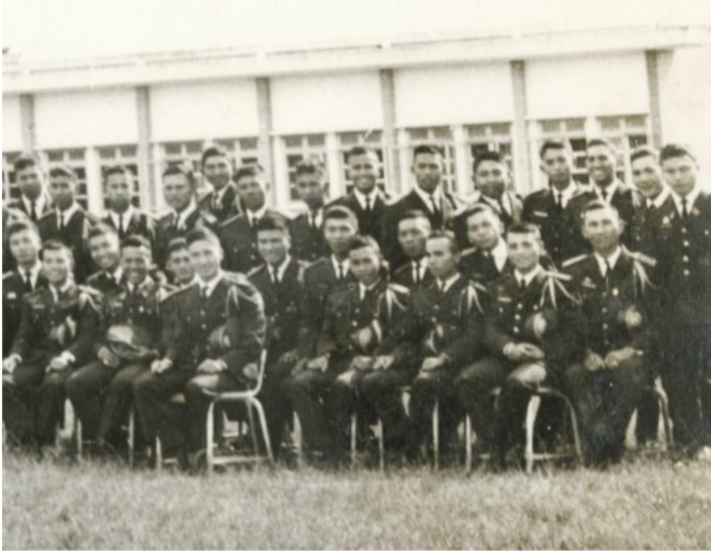
Đại Đội A/21 (Ảnh chụp trước khi mãn khoá tháng 10/1966)