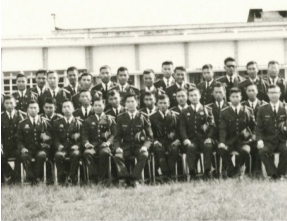
Đại Đội C/21 (Ảnh chụp trước khi mãn khoá tháng 10/1966)