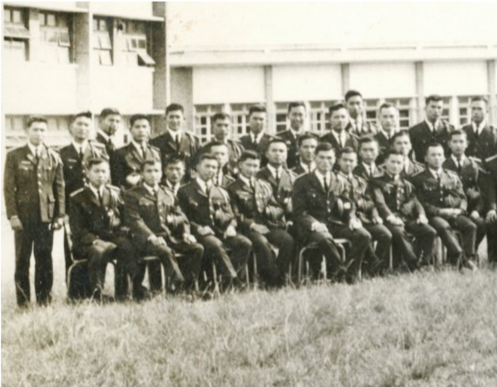
Đại Đội D/21 (Ảnh chụp trước khi mãn khoá tháng 10/1966)